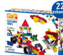
BASIC 401 AMŽIUS 5+ 650 VNT.

Idealus rinkinys konstravimo pradžia ugdymo įstaigose. Didelė erdvinis figūrų įvairovė padės lavinti erdvinį ir loginį mąstymą, kūrybiškumą bei smulkiąją motoriką.