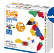
BASIC 001 PAŽINTINIS RINKINYS (PLOKŠČIAS) AMŽIUS 5+ 60 VNT.

Pirmoji pažintis su japoniškais „LaQ“ konstruktoriais! Schemose modeliai pavaizduoti realaus dydžio, todėl mokytis bus dar lengviau ir smagiau!