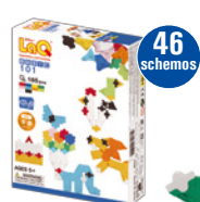
BASIC 101 PAŽINTINIS RINKINYS (POKŠČIAS) AMŽIUS 5+ 185 VNT.

Ypač didelė realaus dydžio schemų įvairovė – net 46! – pasižymintis rinkinys ilgam sutelkęs vaikų dėmesį, leis išbandyti įvairaus sudėtingumo 2D modelių konstravimą.