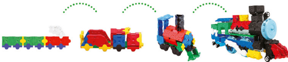
2D ir 3D modeliai iš tų pačių detalių