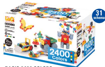
BASIC 2400 COLORS AMŽIUS 5+ 2400 VNT. 60 VNT.

Speciali Basic serijos instrukcijų knygelė! Tinka vienu metu konstruoti 20-30 vaikų grupei.