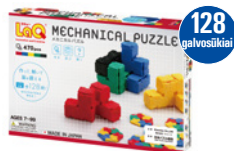
MECHANICAL PUZZLE AMŽIUS 5+ 470 VNT.

Rinkinys tikriems galvočiams, kurie mėgsta ne tik konstruoti, bet ir galvosūkius spręsti bei juos kurti! „LaQ Mechanical Puzzle“ išsiskiria galimybėmis spręsti 4 tipų dėliojimo ir konstravimo galvosūkius, kurių iš viso yra net 128.