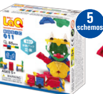
BASIC 011 PAŽINTINIS RINKINYS (ERDVINIS) AMŽIUS 5+ 85 VNT.

Pažintinis „LaQ“ rinkinys, kuris padės išmokyti konstruoti 3D modelius.