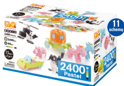
BASIC 2400 PASTEL AMŽIUS 5+ 2400 VNT. 60 VNT.

Didžiuosiuose „Basic“ rinkiniuose rasite viską, ko reikia perprasti „LaQ“ konstravimo technikoms bei išlaisvinti kūrybiškumui. Juose detalės patogiai sudėtos plastikinėse dėžėse, o kiekvienas toks rinkinys turi išsamų vadovą pedagogui su pagrindinėmis detalių kombinacijomis. Instrukcijos padės greičiau perprasti konstravimo su „LaQ“ subtilybes bei galimybes ir nerti į kūrybos ir konstravimo pasaulį.