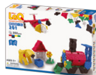
BASIC 201 AMŽIUS 5+ 350 VNT.

Šis rinkinys – tikras atradimas, norintiems išmokyti konstruoti sudėtingesnius modelius – tiek plokščius, tiek erdvinius ir judančius! Su juo vaikai įvaldys net 12 skirtingų „LaQ“ konstravimo technikų, išsamiai pateiktų instrukcijų knygelėje.