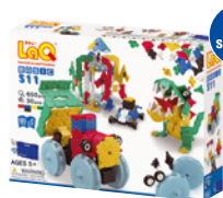
BASIC 511 AMŽIUS 5+ 650 VNT. 30 VNT.

Su šiuo rinkiniu vaikai išmoks 8 unikalios „LaQ“ konstravimo technikas, o 30 rinkinyje esančių specialių „Hamacron“ dalių (įvairūs ratai ir jų ašys) išmoks konstruoti judančius modelius.