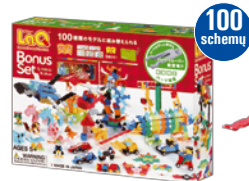
BONUS SET su žnyplėmis detalėmis atskirti AMŽIUS 5+ 1180 VNT. 20 VNT.

„PAX 264“ su 2 instrukcijų knygelėmis. Tinka derinti su įprastomis „LaQ“ detalėmis. Iš PAX detalių taip pat galima sukonstruoti modelius! Tinka vienu metu konstruoti 10 vaikų grupei.