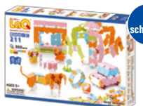
BASIC 211 AMŽIUS 5+ 350 VNT.

Rinkinys tikriems galvočiams, kurie mėgsta ne tik konstruoti, bet ir galvosūkius spręsti bei juos kurti! „LaQ Mechanical Puzzle“ išsiskiria galimybėmis spręsti 4 tipų dėliojimo ir konstravimo galvosūkius, kurių iš viso yra net 128.