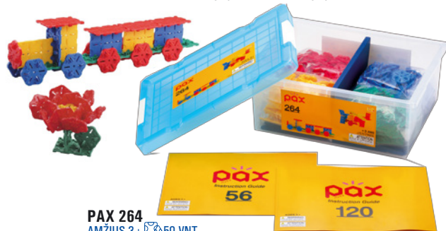
PAX 264 AMŽIUS 3+ 50 VNT.

Speciali Basic serijos instrukcijų knygelė! Tinka vienu metu konstruoti grupei iki 15-25 vaikų grupei.